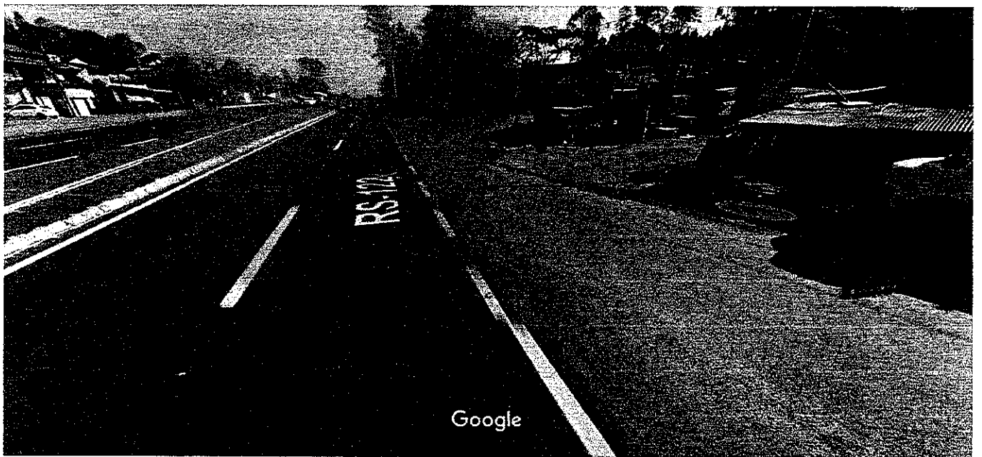
Captura da imagem: set 2017 © 2018 Google